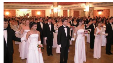
69. Ball der Alt-Hietzinger